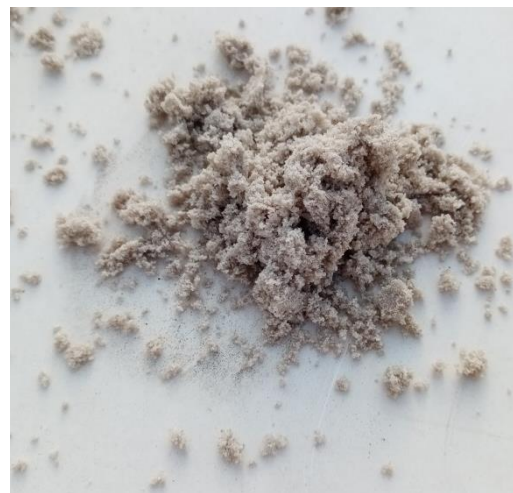
příklad nevhodné frakce