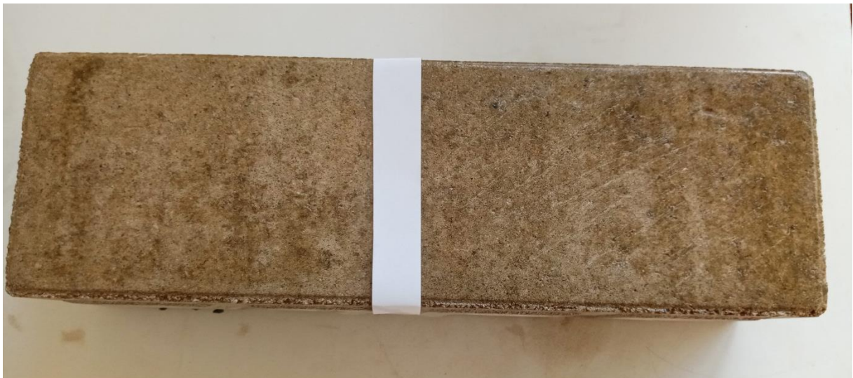
1 vrstva politůry