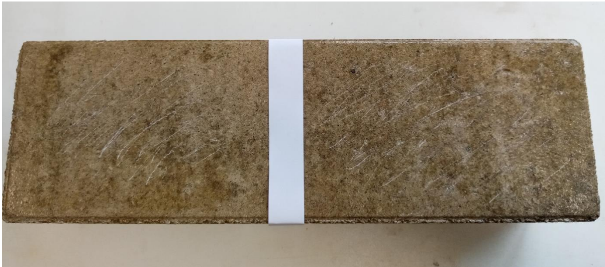
2 vrstvy politůry